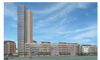
Hammarby Sjöstad, Sverige

Stockholms Stadsbyggnadskontor, Skanska og Wihlborgs Fastigheter Nye bykvarterer med boliger, erhverv, butikker og restauranter, Hammarby Sjöstad, Stockholm, Sverige. 82.000 m 2 + 27.000 m 2 garage. Indbudt konkurrence.