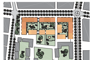
Västra Hamnen, Malmö, Sverige

Vita Örn Fastigheter / NCC Sverige Västra Hamnen, Malmö, Sverige. 80 lejligheder og butikker i Kv. Flaggskepparen. Ca. 8.500 m 2 . Projektforslag.