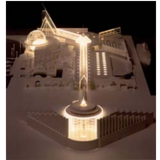
Scandinavia Center, USA

Privat investor / pensionsfonde Scandinavia Center, San Francisco, USA. Scandinavia Center er et havneprojekt placeret midt i San Franciscos centrale kystlinie. Projektet indeholder et hotel med 370 værelser og konferencecenter, et informationscenter for FN, udstillingsbygninger, kontorer, havnepark og cruiseterminal. 100.000 m 2 . Projektforslag. 1. præmie i konkurrence.