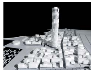
Miiduranna Port, Estland

Miiduranna Tehas AS Miiduranna Port, Tallinn, Estland. Boliger, erhverv og shopping. Boliger: 95.000 m 2 . Erhverv: 95.000 m 2 . Højhus: 31.000 m 2 . Projektforslag. 1. præmie i international arkitektkonkurrence.