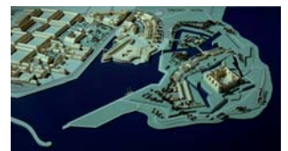
Bykvarter v. Kronborg, Helsingør

Rederiet Lauritzen Bykvarter v. Kronborg, Helsingør. Projektet tager udgangspunkt i det fine, historiske området ved Kronborg Slot i Helsingør. Det nye bykvarter består af boliger, erhverv, butikker og kulturelle institutioner. 100.000 m 2 . Projektforslag.