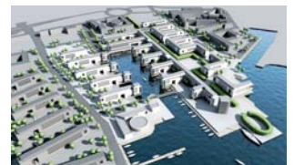
Bykvarter i Tallinns havn, Estland

Manutent OÜ, Tallinn, Estland Nyt bykvarter i Tallinns havn med boliger, butikker, restauranter og erhverv. 120.000 m 2 . Projektforslag.