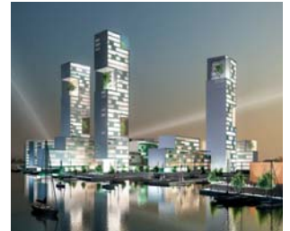
Young City, Gdansk, Polen

Baltic Property Trust A/S 'Young City', Gdansk, Polen. Udviklingsplan for et nyt havneområde med boliger, kontorer, indkøbscenter og kulturelle faciliteter. 100 hektar grundareal, 1 mio. etagemeter. Under udvikling.