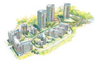
Takatsukayama, Kobe, Japan

Sekisui House, Ltd., Osaka, Japan Takatsukayama – 2.800 boliger, Kobe, Japan. 27.000 m 2 . Skitseprojekt.