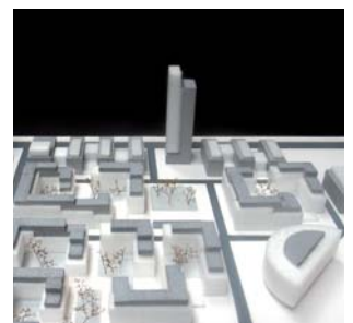
Megrame, Vilnius, Litauen

Bygherre Projekt Nordic Outlet Urbanization Gryfino, Szczecin, Polen. Masterplan for nyt boligområde med 450 lejligheder / rækkehuse udenfor Szczecin i Polen. 48.000 m 2 . Projektforslag.