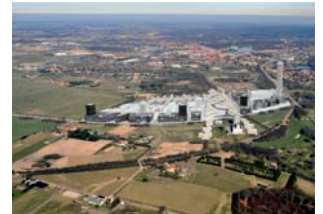
Hillerød Center Syd

Bygherre Projekt Barzman Masterplan i Oman. Shopping mall 150.000 m 2 . Hospital 20.000 m 2 . Hotel 22.000 m 2 . Skitseforslag i indbudt konkurrence.