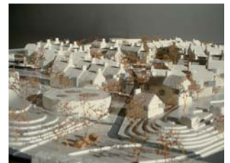
Gryfino, Szczecin, Polen

Bygherre Projekt Asgaard Group A/S Hillerød Center Syd. Masterplan for nyt byområde syd for Hillerød med boliger, erhverv og butikker. 670.000 m 2 . Projektforslag.