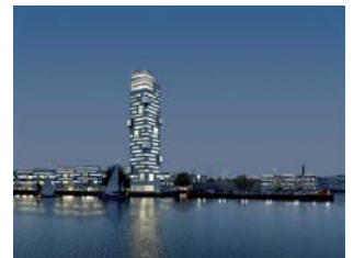
Noblessner, Tallinn, Estland

BLRT Invest Tallinn Noblessner, Tallinn, Estland. Boliger fra 5 til 29 etager, erhverv og shopping. Boliger: Ca. 80.000 m 2 . Erhverv: Ca. 112.500 m 2 . Parkering: Ca. 60.500 m 2 . 1. præmie i international arkitektkonkurrence. Under udvikling. Lokalplan godkendt.