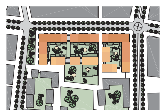
Västra Hamnen, Malmö, Sverige

Bygherre Projekt Vita Örn Fastigheter / NCC Sverige Västra Hamnen, Malmö, Sverige. 80 lejligheder og butikker i Kv. Flaggskepparen. Ca. 8.500 m 2 . Projektforslag.