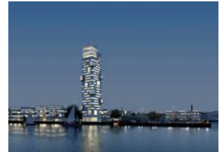
Noblessner, Tallinn, Estland

Bygherre Projekt BLRT Invest Tallinn Noblessner, Tallinn, Estland. Boliger, kontor og butikker m.m. Boliger: Ca. 80.000 m 2 . Erhverv: Ca. 112.500 m 2 . Parkering: Ca. 60.500 m 2 . 1. præmie i international arkitektkonkurrence.