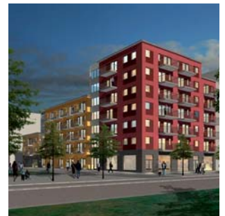
Kv. Klyvaren, Malmø, Sverige

Bygherre Projekt Asgaard Group A/S Hillerød Center Syd. Masterplan for nyt byområde syd for Hillerød med boliger, erhverv og butikker. 670.000 m 2 . Projektforslag.