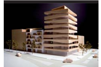
Park Point - Klyvaren, Malmø, Sverige

Bygherre Projekt Park Point / NCC Kv. Klyvaren, Malmø, Sverige. Lægeklinik samt ejerboliger. Ca. 3.000 m 2 klinikformål samt 1.500 m 2 boliger. Arkitekturrådgivning i partnerskab - under udvikling.