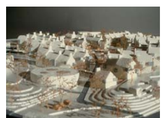
Gryfino, Szczecin, Polen

Bygherre Projekt Nordic Outlet Urbanization Gryfino, Szczecin, Polen. Masterplan for nyt boligområde med 450 lejligheder / rækkehuse udenfor Szczecin i Polen. 48.000 m 2 . Projektforslag.