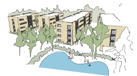
"Glødelampen" storparcel B, Herlev

Bygherre Projekt DAB - Dansk almennyttigt Boligselskab "Glødelampen" Hørkær, storparcel B, Herlev 4 punkthuse i 4 etager med 47 almene boliger fra 2-4 værelser. Ca. 4.500 m 2 2. præmie i konkurrence.