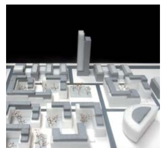
Megrame, Vilnius, Litauen

Bygherre Projekt Nordic Outlet Urbanization Szczecin, Polen. Boliger, erhverv og shopping. 550.000 m 2 , 2 mio. etagemeter. Projektforslag.