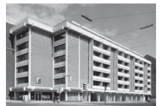
Lejligheder, H. C. Ørsteds Vej

Bygherre Projekt Sparekassen SDS 48 ejerboliger på Gl. Kongevej / H. C. Ørsteds Vej i København.