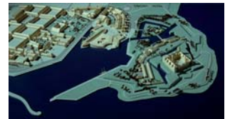
Bykvarter v. Kronborg, Helsingør

Rederiet Lauritzen Bykvarter v. Kronborg, Helsingør. Projektet tager udgangspunkt i det fine, historiske område ved Kronborg Slot i Helsingør. Det ny bykvarter består af boliger, erhverv, butikker og kulturelle institutioner. 100.000 m 2 . Projektforslag.