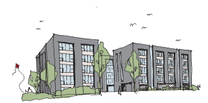
"Glødelampen" storparcel F, Herlev

Bygherre Projekt KAB - Bygge- og Boligadministration S.m.b.a. "Glødelampen" Hørkær, storparcel F, Herlev 3 rektangulære punkthuse i 5 etager med 55 almene boliger fra 2-4 værelser. Bil- og cykelparkering under bygningerne. Ca. 5.500 m 2 Konkurrenceforslag