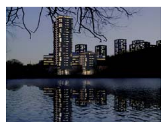
Stubinen i Stockholm, Sverige

Bygherre Projekt Doughty Hanson & Co. Stubinen, Højhus i Stockholm. Ca. 8.000 m 2 . Skitseprojekt.