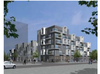
Maria Stationsområde, Sverige

Bygherre Projekt Wohnwerk Fastighetsutveckling Maria Stationsområde, Kv. Berga, Helsingborg, Sverige. Bolibebyggelse i åben konstruktion i 2-6 etager med 2-4 rums lejligheder. Udføres efter passiv-hus standard. 5.450 m 2 . Arkitektrådgivning i partnering med NCC.