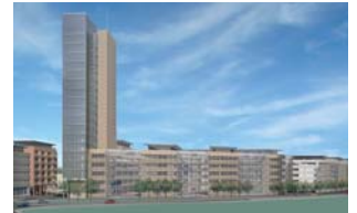
Hammarby Sjöstad, Sverige

Bygherre Stockholms Stadsbyggnadskontor, Skanska og Wihlborgs Fastigheter Projekt Nye bykvarterer med boliger, erhverv, butikker og restauranter, Hammarby Sjöstad, Stockholm, Sverige. 82.000 m 2 + 27.000 m 2 garage. Indbudt konkurrence.