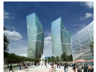
2 tårne, Ørestad Downtown

Bygherre Projekt NCC Danmark A/S og Ørestadsselskabet A/S 2 tårne på 21 etager i den nye bydel, Ørestad Downtown, Køben- havn. Arkitektrådgiver for Studio Daniel Libeskind, USA. Kontortårn, 18.276 m 2 . Boligtårn, 18.457 m 2 . Projektforslag.