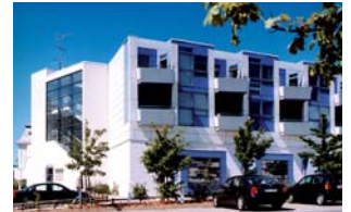
Lejligheder, Rungsted Bytorv

Bygherre Projekt CG. Jensen A/S Rungsted Bytorv - 38 boliger samt forretninger, supermarked og café. 3.100 m 2 . Arkitektådgivning.