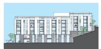
Kv. Bomben, Stockholm, Sverige

Bygherre Projekt Doughty Hanson & Co. Kv. Bomben, Liljeholmen - Butikker (2.000 m 2 ) og boliger (9.000 m 2 ) i Stockholm, Sverige. Projektforslag.