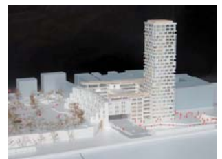
Carlsberg, Ny tap

Bygherre Projekt DIS Skindergade 40, København - Ombygning af eksisterende ejendom, herunder fredet forhus til 5 lejligheder. Ca. 960 m 2 .