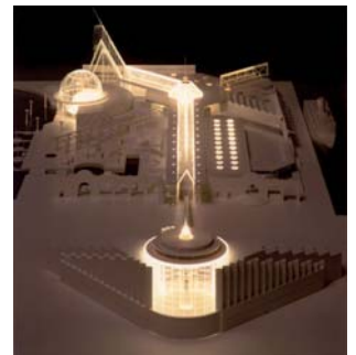
Scandinavia Center, USA

Bygherre Projekt Privat investor / pensionsfonde Scandinavia Center, San Francisco, USA. Scandinavia Center er et havneprojekt placeret midt i San Franciscos centrale kystlinie. Projektet indeholder et hotel med 370 værelser og konferencecenter, et informationscenter for FN, udstillingsbygninger, kontorer, havnepark og cruiseterminal. 100.000 m 2 . Projektforslag. 1. præmie i konkurrence.